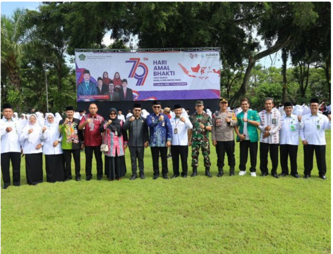
Dandim 0804/Magetan, Hadiri Upacara Hari Amal Bhakti ke-79 Kemenag RI Tahun 2025